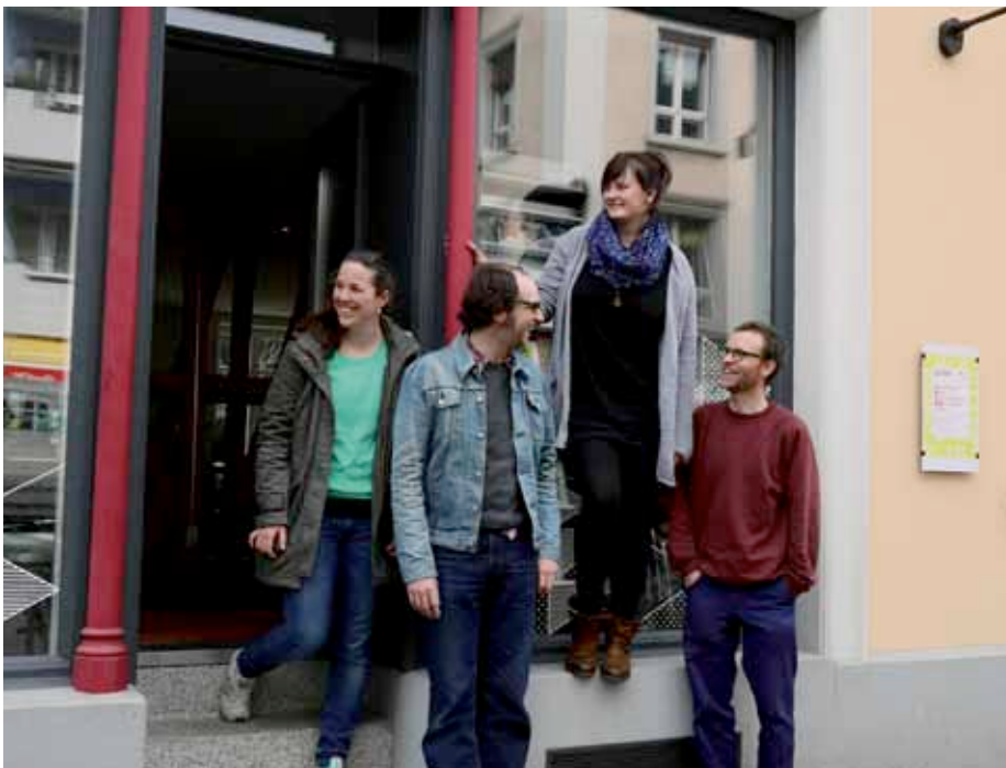
Das Mojawi-Team vor dem neuen Büro an der Wartstrasse 5

Die Mojawi hatte im 2014 insgesamt rund 4963 Begegnungen mit Jugendlichen, davon 77% mit männlichen Jugendlichen. Darin sind auch wiederholte Kontakte enthalten. In der Intensität unterscheiden sich die Kontakte und reichen vom «Hallo, wie geht's» bis zu längeren Gesprächen und Beratungen zu diversen Themen aus ihren Lebenswelten.