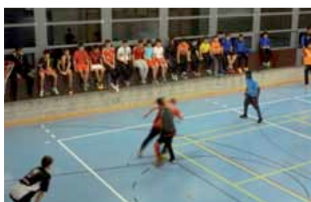
Projekt Open Hall (offene Turnhalle Wallrüti)