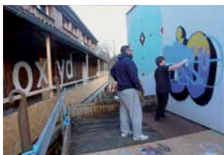
Graffiti Workshop im Oxyd