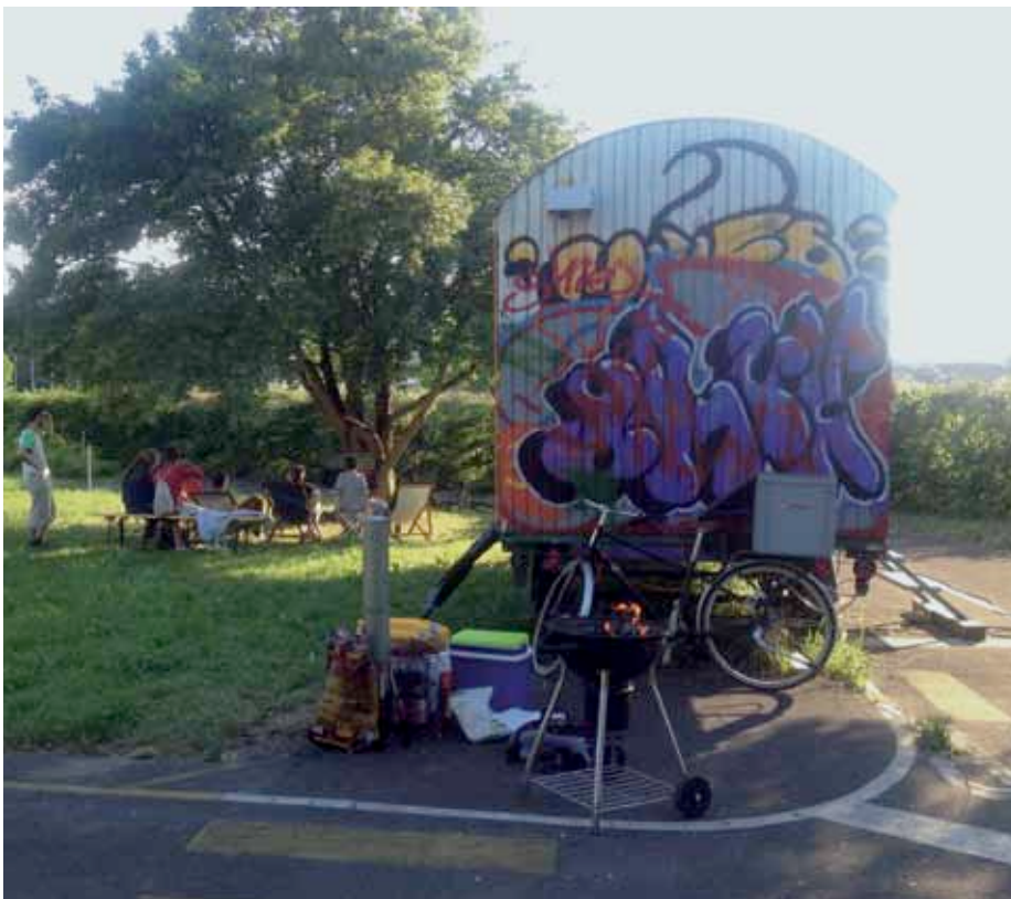
Unser Bauwagen im alten Verkehrsgarten: Betreten erlaubt!

Ende Jahr bekamen wir die Erlaubnis, im 2015 das Gelände nochmals zwischennutzen zu dürfen. Alle Register sollen im 2015 gezogen werden, um für noch mehr Jugendliche einen Ort zu schaffen, an welchem sie und ihre Ideen erwünscht sind – ganz nach dem Motto: «Betreten erlaubt!»