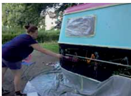
Renovation Jugendkiosk in Töss