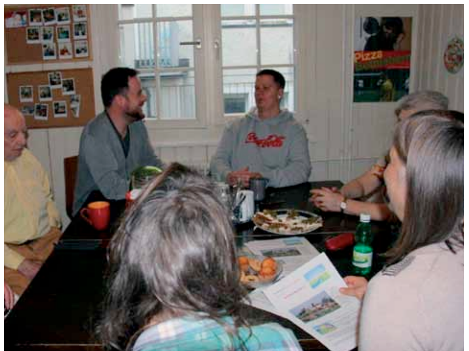
Vernetzung durch Begegnung