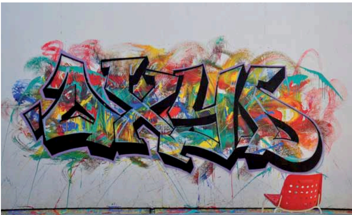
Graffito entstanden in der offenen Graffiti Werkstatt im Oxyd

Durch die verschiedenen Events im oxyd konnten bei vielen Besuchenden Vorurteile bezüglich Graffiti abgebaut werden. Es sind viele Gespräche und Diskussionen bei den Erwachsenen entstanden, die realisiert haben, dass Graffiti nicht «Geschmiere» sind und durchaus als Kunst bezeichnet werden können. Die Jugendlichen in der Graffitiwerkstatt haben gelernt, wie ein Graffiti entsteht und welche Arbeit dahintersteckt. Somit wurde das Ziel der Ausstellung, die unterschiedlichen Generationen zusammenzubringen, auf jeden Fall erreicht.