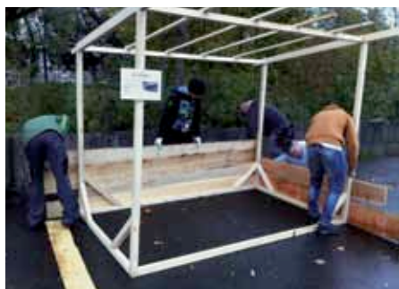
Bau Unterstand in der Hardau